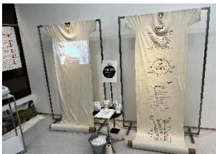
TOKYO KNIT 総合展 2022 での リサイクループプロジェクト展示模様