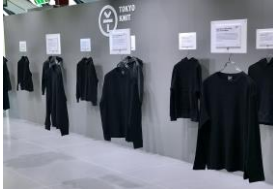
2020 年 1 月 PITTI UOMO での展示模様