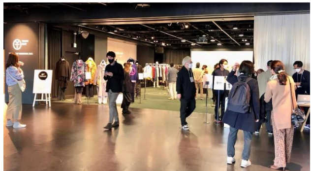
TOKYO KNIT 総合展 2022「語り始めたファクトリー」 （2022年2月25日・26日@渋谷 HIKARIE 8F COURT & CUBE）の様様

また、初日（2月21日（火）16時～予定）にはメディアの皆様向けのプレビューを開催いたしますので併せてご案内させていただきます。